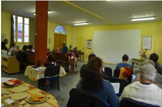
Une partie de l'assistance et de la table dressée pour le verre de l'amitié avec les spécialités culinaires

Célébration de la JMP retardée pour cause de neige a bien eu lieu. Cette célébration fraternelle et recueillie est toujours très appréciée par les 3 Églises chrétiennes de Lunel présentes.